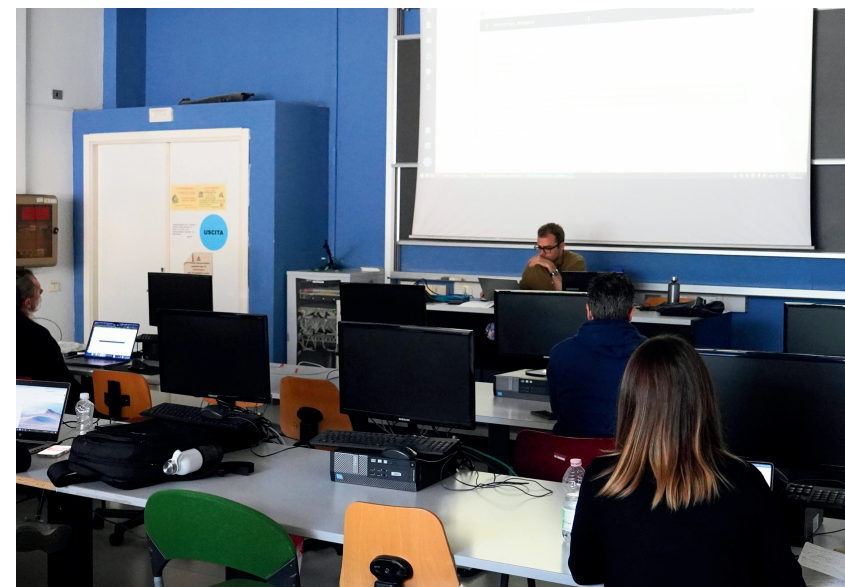
Sviluppo rapido di applicazioni web con Elixir e Phoenix