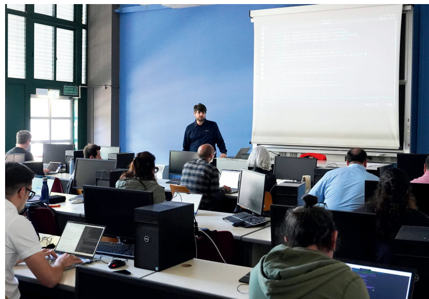
Sei pronto per OpenID Federation?