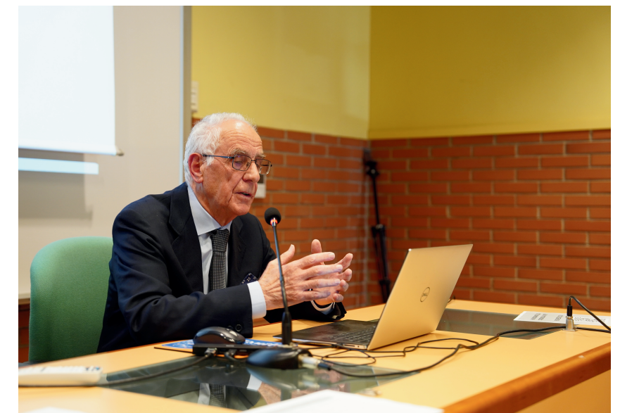
Introduzione al Quantum Computing e al Quantum Internet