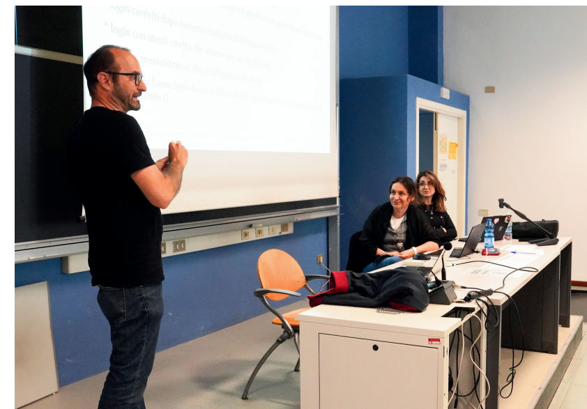
Un giorno da BlueTeam 2: log fantastici e dove trovarli